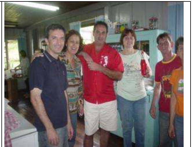
A alegria fraterna do encontro