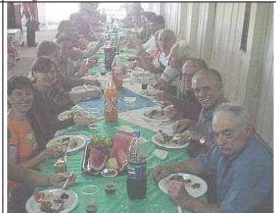
Pranzo italiano con carne di struzzo e vino coloniale....