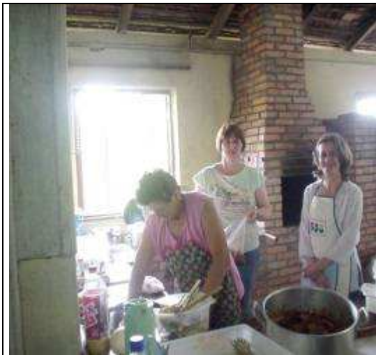
Preparativos para o Ágape da família